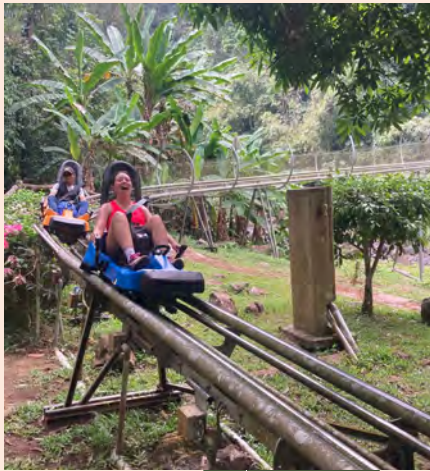
Selection of Photos Supplied by Phat Tire